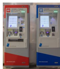
automates de vente